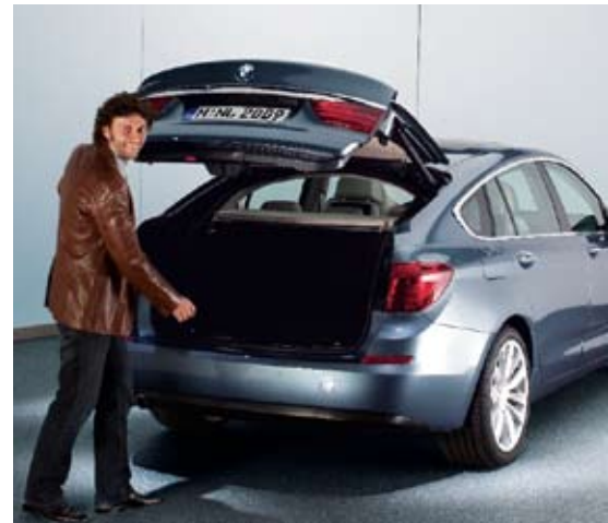
Jonas Kaufmann ist begeistert – sowohl vom großzügigen Interieur als auch vom praktischen Kofferraum. Dieser ist für kleineres Gepäck auch über eine separate Klappe (oben) zu öffnen

Lehnenneigung von bis zu 40 Grad und eine Variabilität der Sitzfläche um bis zu zehn Zentimeter.