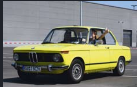
Dieser BMW 1502 startete bei der Youngtimer-Ausfahrt der Filiale Rath Anfang Mai

Das BMW Classic Center unterstützt seine Kunden in allen für sie relevanten Bereichen: von Reparaturen über die Beschaffung von Ersatzteilen bis hin zur Unterstützung bei Ausfahrten.