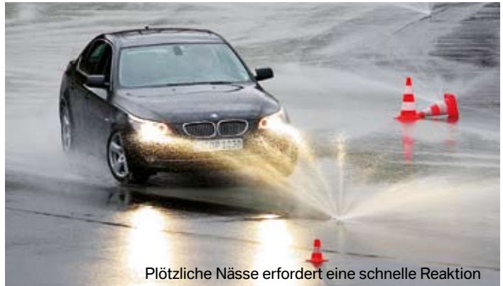
Plötzliche Nässe erfordert eine schnelle Reaktion

Neu ist das Kombi-Training für PKW und Motorrad in der Sommersaison 2009. Je einen halben Tag geht es dann erst auf dem Motorrad, nachmittags im PKW über die Strecke. 205 Euro kostet dieses Trainingspaket üblicherweise, BMW Kunden erhalten es zum Vorzugspreis von 149 Euro. Die Schutzkleidung ist in diesem Preis bereits enthalten. Nur zwölf Teilnehmer pro Gruppe garantieren eine individuelle Betreuung.